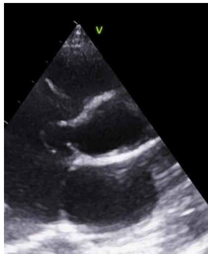
Figura 1: Ecocardiograma com aneurisma de seio de valsalva do folheto coronariano direito

Paciente do sexo masculino, 10 anos, branco, assintomático, procurou atendimento com cardiologista há 1 ano devido a sopro sistólico detectado pelo pediatra. O cardiologista identificou sopro sistólico crescente-decrescente em foco aórtico, com a segunda bulha (B2) bem audível. Ao ecocardiograma, destacou-se valva aórtica bicúspide, estenose aórtica leve e aneurisma do seio de valsalva do folheto coronariano direito (figura 1).